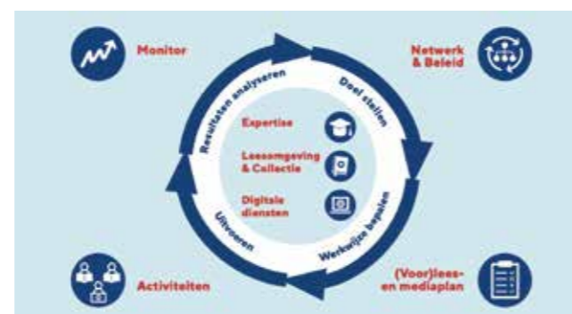
Afbeelding: De aanpak de Bibliotheek op school is opgebouwd uit verschillende, samenhangende bouwstenen.

In 2025 vonden verkennende gesprekken plaats met 3 nieuwe locaties. De samenwerking met PRO Emmen is inmiddels opgestart; in 2026 openen we daar de Bibliotheek op school. De overige gesprekken kunnen in 2026 leiden tot nieuwe structurele samenwerkingen. Net als in het primair onderwijs is het uitgangspunt een aanpak waarbij Facet de school structureel ondersteunt bij het leesonderwijs via een integrale bouwstenenaanpak voor leesbevordering.